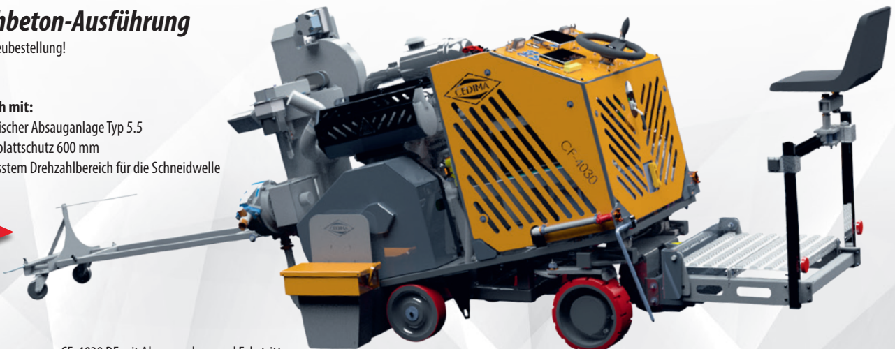
CF-4030 DF mit Absauganlage und Fahrtritt